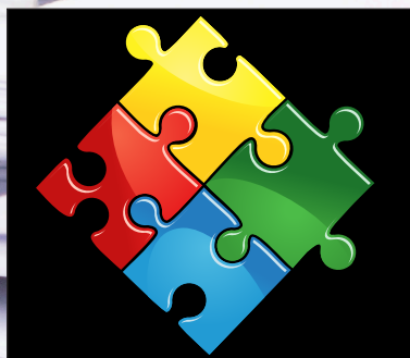
Sektorårsmøder 2016 Se side 9-10