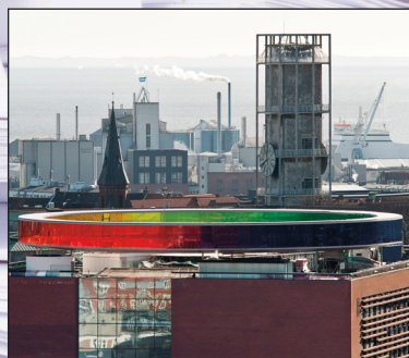
Medlemsarrangementer Se side 11-14